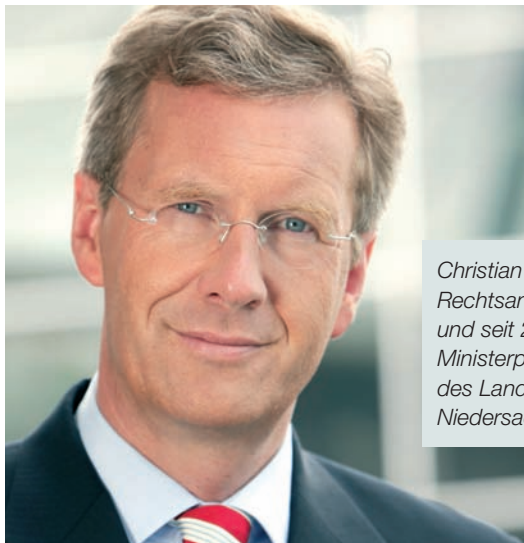
Christian Wulf (48), Rechtsanwalt und seit 2003 Ministerpräsident des Landes Niedersachsen.