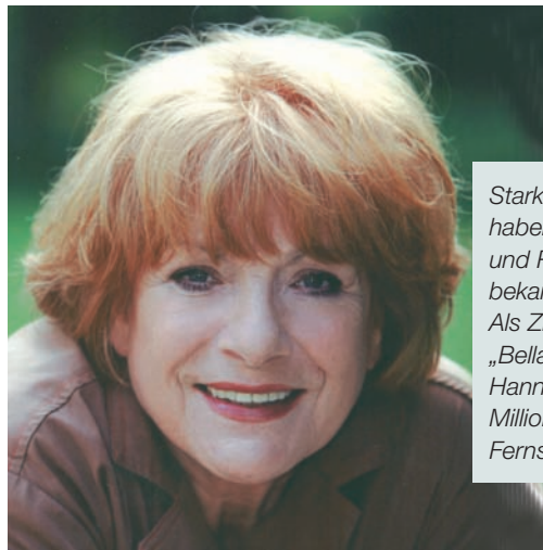
Starke Frauencharaktere haben die Schauspielerin und Regisseurin bekannt gemacht. Als ZDF-Kommissarin „Bella Block“ begeistert Hannelore Hoger (65) Millionen von Fernsehzuschauern.

„So selbstverständlich, wie wir Frauen zu Früherkennungs-Untersuchungen gehen, können wir auch wegen einer Blasenschwäche einen Arzt aufsuchen“, sagt die Schauspielerin. Einer betroffenen Freundin würde sie konkrete Hilfe zur Selbsthilfe anbieten: „Wenn du willst, begleite ich dich zum Arzt, und hinterher unternehmen wir etwas Schönes.“