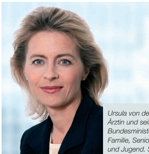
Ursula von der Leyen (49), Ärztin und seit 2005 Bundesministerin für Familie, Senioren, Frauen und Jugend. Sie ist Mutter von sieben Kindern.

„Die Blasenfunktion im Griff zu haben, ist eine wichtige Voraussetzung, um ein unabhängiges und selbstbestimmtes Leben führen zu können. Wenn, aus welchen Gründen auch immer, diese Fähigkeit verloren geht, bringt das einen beschämenden Kontrollverlust mit sich. Selbstwertgefühl und Lebenslust gehen verloren. Nur wenige Betroffene bekennen sich zu ihrem Leiden. Und so kommt es, dass zwar über fünf Millionen Menschen in der Bundesrepublik Deutschland unter ungewolltem Harnver-